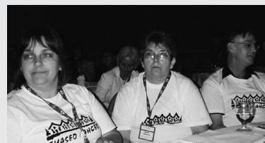
CHASEO delegates at the CHF Canada business meeting

Le dîner est servi! L'ACHEO a organisé un dîner pour les délégués de la région lors de l'AGA