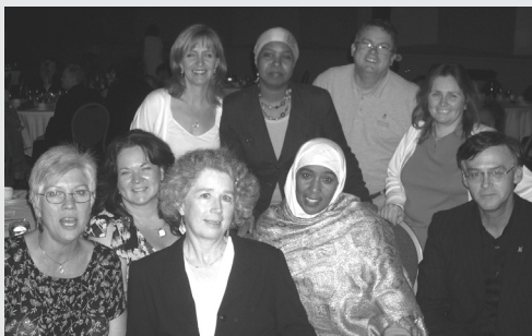
CHASEO folks at the AGM closing dinner Des gens de l'ACHEO lors du souper de clôture de l'AGA