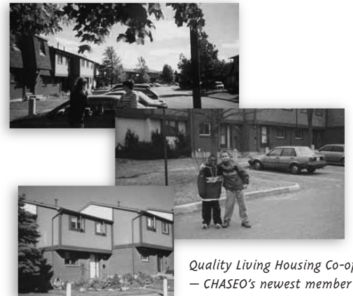
Quality Living Housing Co-op — CHASEO's newest member Quality Living Housing Co-op — Le membre le plus récent de l'AHCEO

Construite en 1984, la coopérative Quality Living compte 101 logements coopératifs et est située à Nepean. C'est une collectivité coopérative dans laquelle on y trouve des bénévoles et des nouveaux membres de personnel dévoués. Nous avons hâte de faire davantage votre connaissance au cours des années à venir!