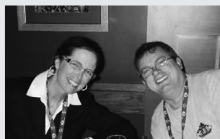
Lunch is on us! CHASEO hosted a lunch for our regional delegates at the AGM.

Le dîner est servi! L'ACHEO a organisé un dîner pour les délégués de la région lors de l'AGA