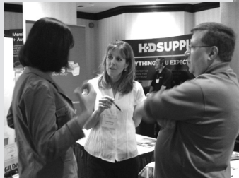
Chatting at the Trade Show. Des membres qui jassent lors du mini-salon conférencier

Le mini-salon conférencier a connu un grand succès cette année : 80 membres de coopératives et 14 fournisseurs y ont participé. Les membres ont dégusté des desserts et du café, et ont eu l'occasion de discuter avec les fournisseurs et les représentants du programme Prix écono-coop. Ce fut une occasion idéale pour les membres d'apprendre davantage sur les économies qu'ils peuvent réaliser pour leurs coopératives et pour eux-mêmes. L'AHCEO était aussi présente afin de promouvoir les services et programmes qu'elle offre ainsi que pour donner un aperçu aux membres du nouveau site Web amélioré de l'AHCEO. Surveiller le lancement du nouveau site Web au cours des prochains mois!