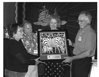
Sarcee Meadows Housing Co-op Ltd receives Rooftops Canada/Abri International — International Service Award.

Félicitations à la Sarcee Meadows Housing Co-op Ltd qui a remporté le Prix inaugural Rooftops Canada/Abri International pour service à l'international. Ce prix récompense un membre de la Fédération de l'habitation coopérative du Canada pour avoir contribué au développement international. Le prix a été décerné à l'AGA de 2008 de la FHCC à Toronto.