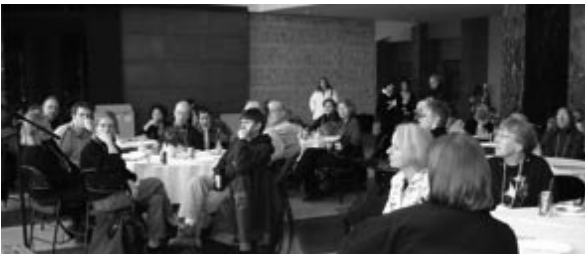
CHASEO's Fall Education Day, 2007

Look for the complete flyer coming soon, and take advantage of the Early Bird registration special!